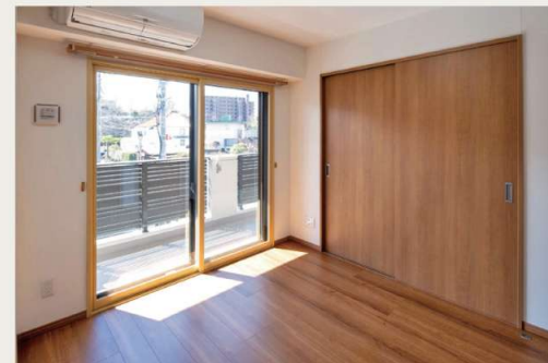
2DK / 洋室