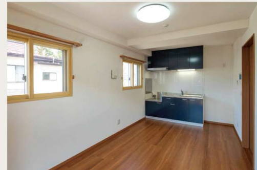
2DK / ダイニングキッチン

各居室は、日当たりに配慮した全世帯南向きとし、階高を抑え室内の梁を最小限にすることで、圧迫感のないゆとりあふれる空間づくりを目指しました。