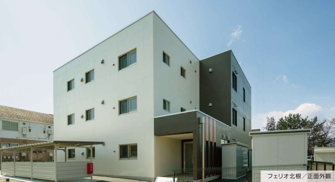
フェリオ北根 / 正面外観