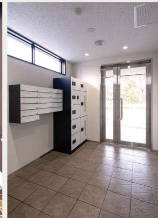
1階 / 風除室