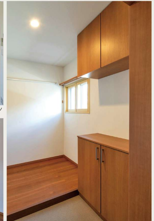
2DK / 玄関