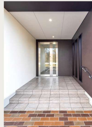
1階 / 玄関ポーチ