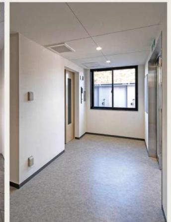
1階 / EVホール

エントランスホールには、不在時でも宅配等の荷物が受け取れる宅配ボックスを設置することにより利便性に配慮いたしました。また、共用出入口、メールコーナー、EVホールは見通しの確保が可能な設計とし、オートロック、モニター付きインターホンを採用することで、セキュリティ強化にも努めました。